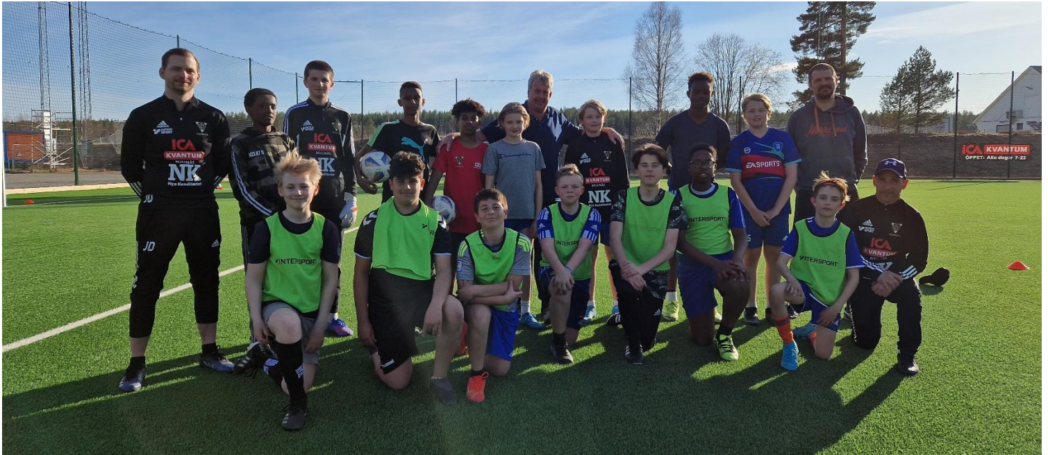
Uppställning på en träning, Sävstaås IP.