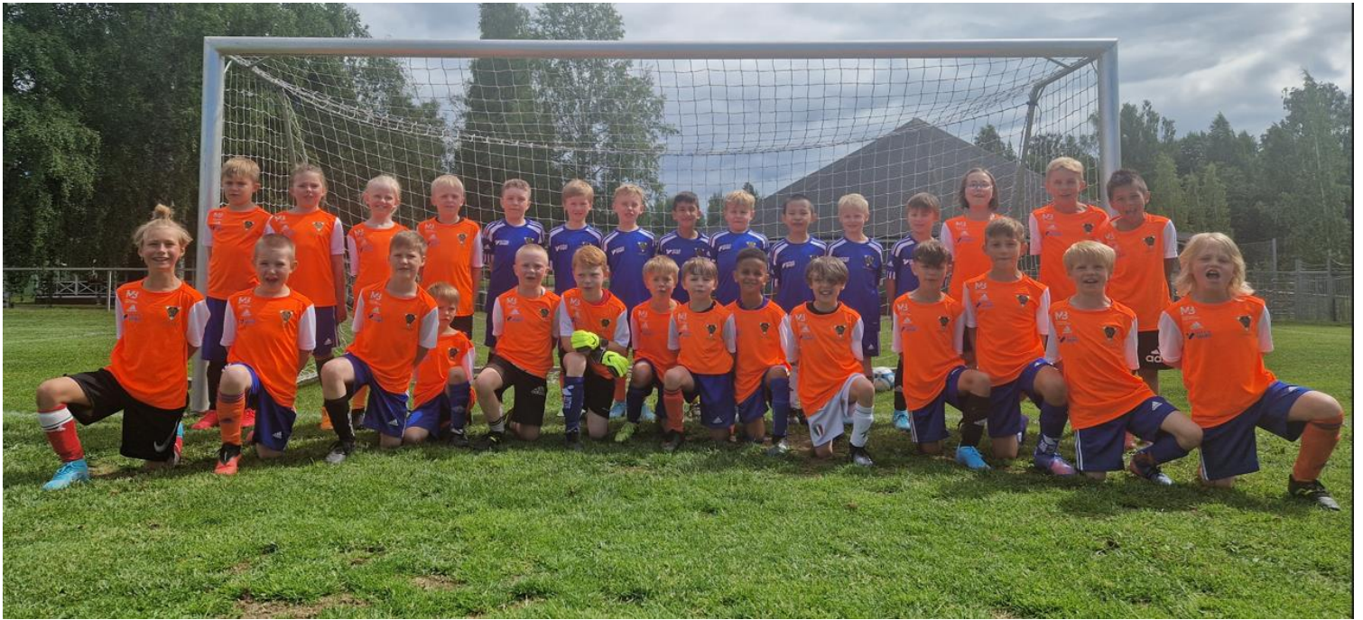
Bild från poolspel i Forsparken, Alfta.