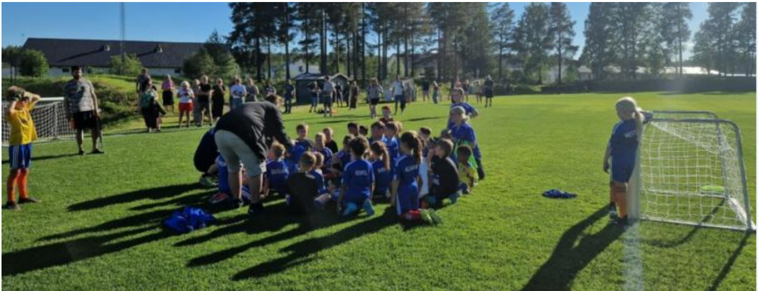
Bild från ett träningstillfälle, Sävstaås IP.