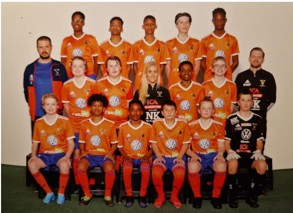
Lagfoto innan säsongen startade, april 2022.