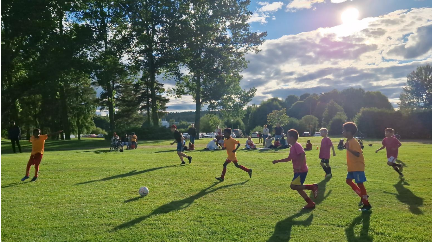
Spännande matcher varje vecka för både barn och föräldrar på Långnäs!