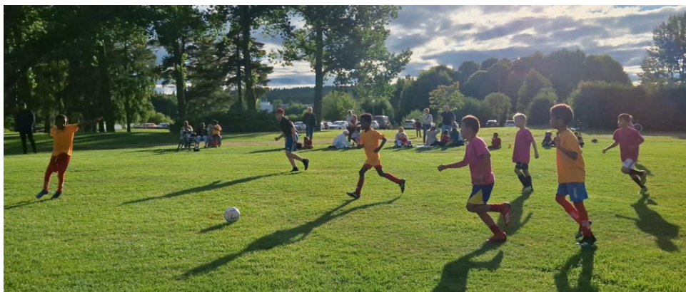
Lilla Champions League