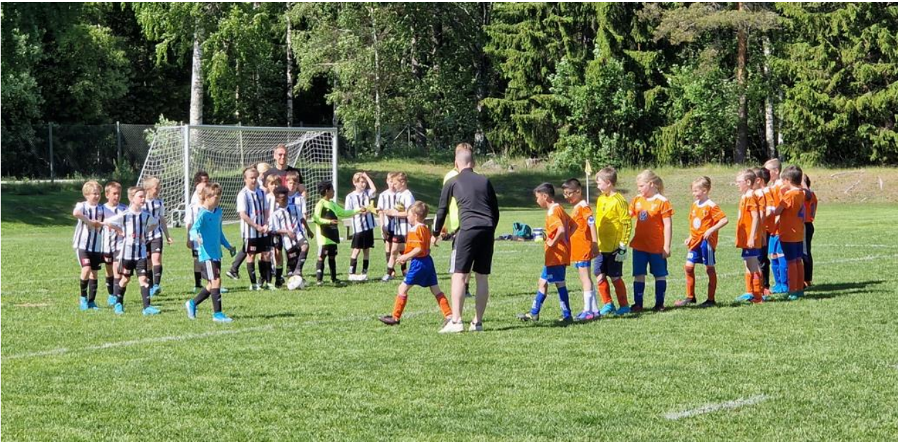
Bild från ett av poolspelen där grabbarna i Bollnäs fotboll och Strand IF tackar efter en match.