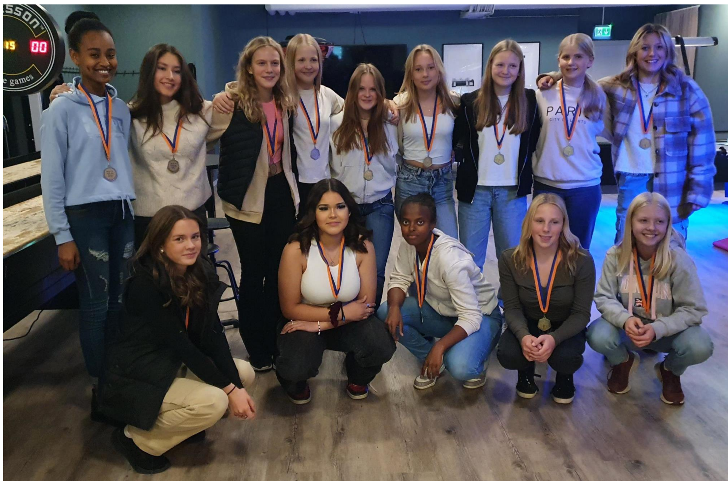
Avslutning på Smedjan konferens.