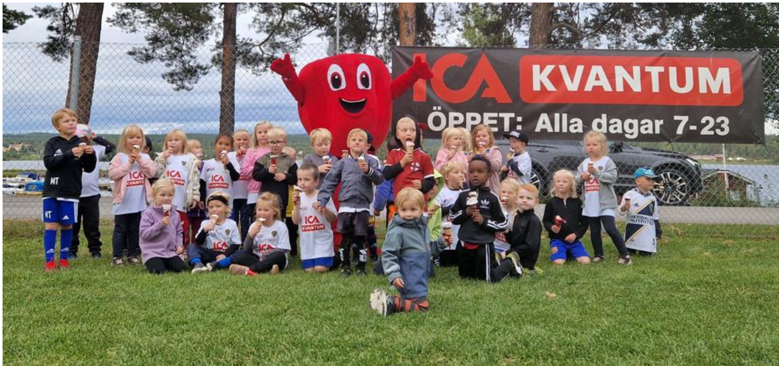
De allra minsta fotbollsspelarna i Bollskoj avslutar säsongen med glass och besök av Paprikan från ICA Kvantum, Bollnäs.