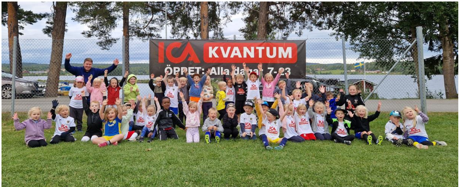
Ett hejarop från Bollskoj!