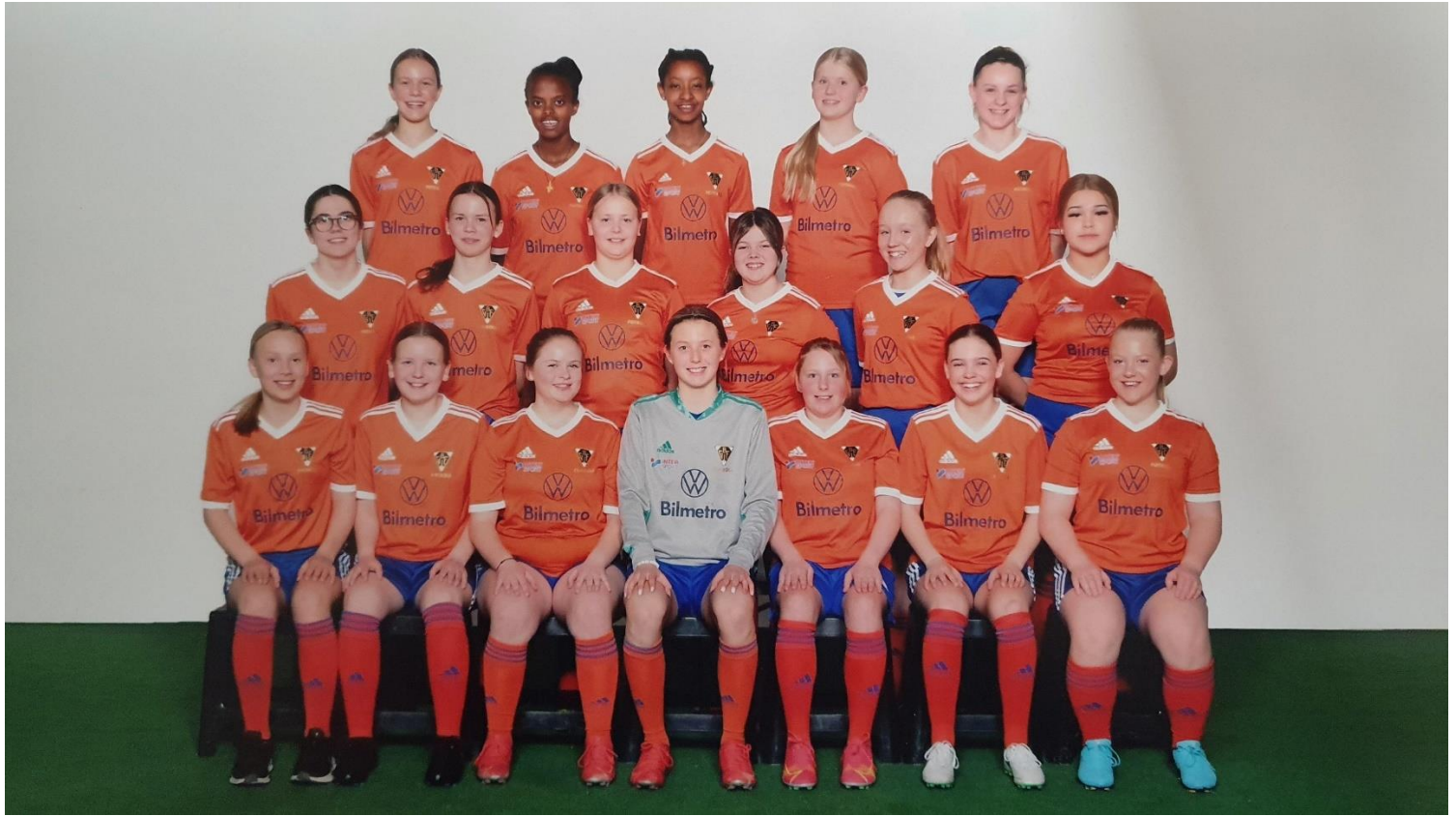
Lagbild på F2008/2009.

Laget visar upp ett moget spel som innehåller ett jobb med bollinnehav och delaktighet.