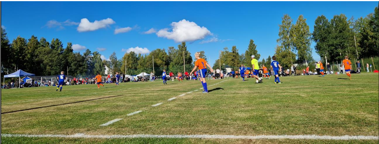
Bollnäs GIF FF P10 möter Rengsjö P10 i Berglocksliret Cup, Forsa.